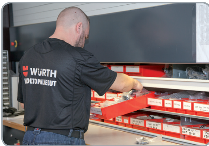
Täydellisestä varaosavarastosta löytyvät varaosat kaikkiin Würth-koneisiin heti hyllystä.