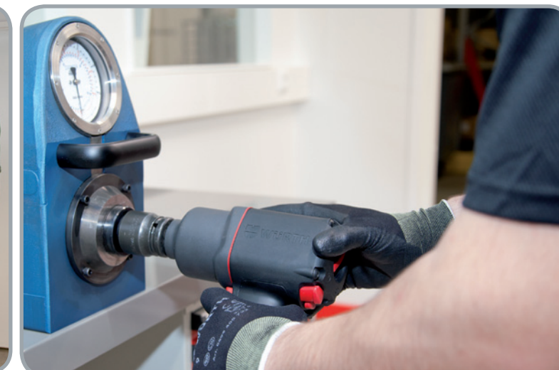
Huolletut koneet koeajetaan ja testataan ennen luovutusta