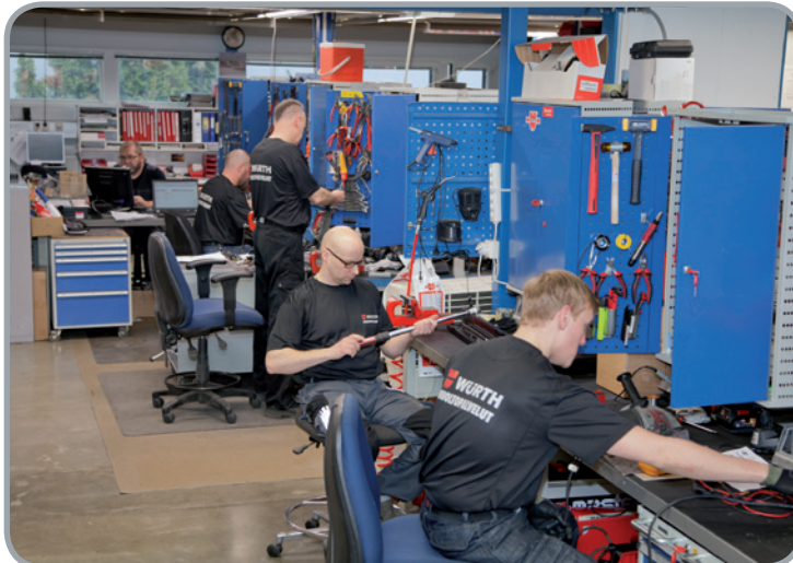
Huollon käytössä on mittavat korjaamotilat ja yli 30 000 nimikkeen varaosavarasto.

Oma toimiva huolto + varaosat kaikkiin Würth koneisiin varmistaa, että asiakkaiden ei tarvitse odotella huollon jonoissa makaavia työvälineitään.