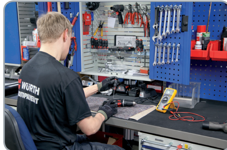
Ammattitaitoiset huoltomiehet, oma varaosavarasto ja nykyaikaiset korjaamotilat varmistavat kattavan huollon kaikille Würth-koneille sekä sen, että koneet palautuvat nopeasti takaisin asiakkaalle.